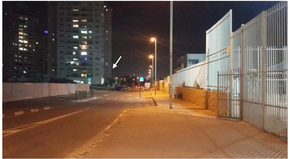
תמונה 9 : בניין מס' 7 ברחוב רבקה גובר (חץ)