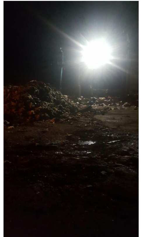
תמונות 4, 5 : תחנת המעבר לאשפה עם שאריות אשפה שלא פונו עם גמר יום העבודה.