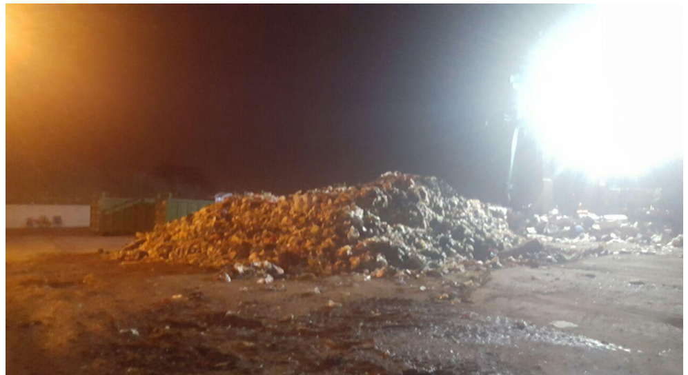
תמונה 3 : תחנת המעבר לאשפה עם שאריות אשפה שלא פונו עם גמר יום העבודה.