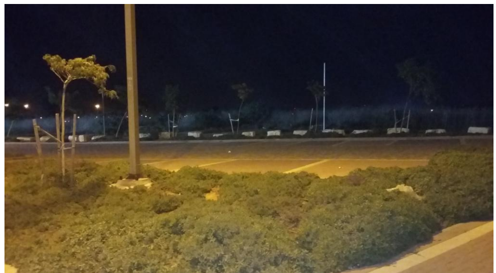
תמונה 8 : רחוב רבקה גובר סמוך למרכז הספורט