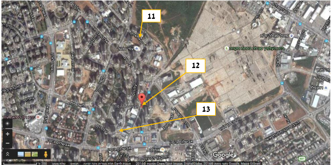
תמונה 2 : תצלום לוויין של אזור נקודות המדידה ב- 21.11.2016 על פי הסדר שמצוין בסעיף 5.5