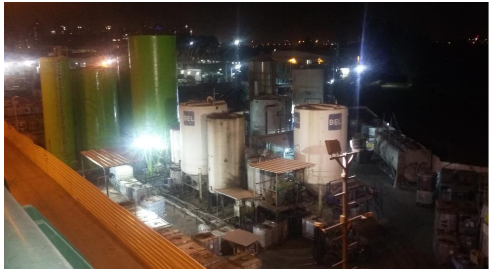
תמונה 7 : מפעל טביב במבט מהגשר לכיוון דרום-מערב